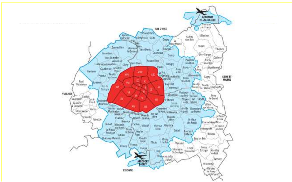
Graphique 2 : La zone des taxis parisiens

La Préfecture de police afin de mieux objectiver les besoins de transports et fixer le nombre de licences supplémentaires a mis en place un indice économique départemental comprenant quatre paramètres : passagers aéroports, gares, nuitées d'hôtel et produit intérieur brut (PIB) de la région Ile-de-France. Cet indice constitue une avancée importante dans la détermination des besoins et a fait l'objet de nombreuses concertations avec les organisations professionnelles. Toutefois il ne résout pas complètement la nécessité de mieux impliquer des collectivités territoriales dans la politique des transports légers de personne.